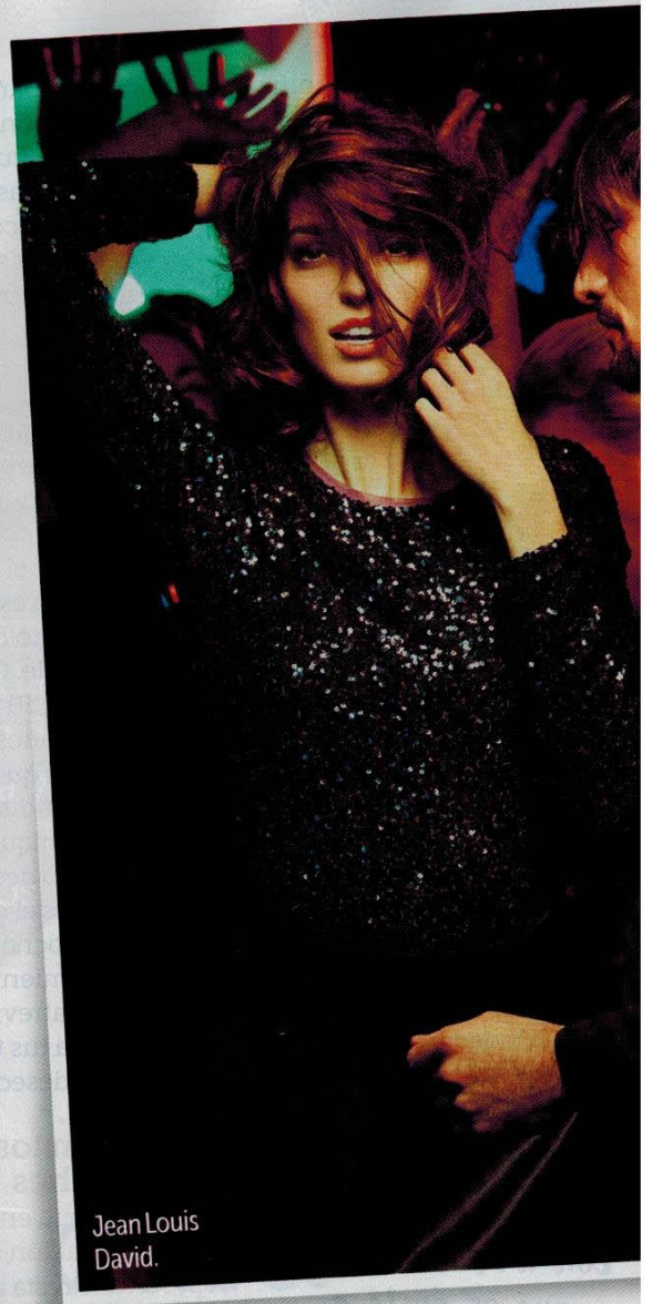
Jean Louis David.