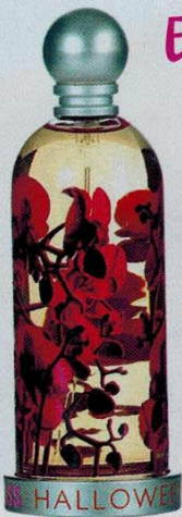
▶ Halloween Kiss, de Halloween. 62 € ▶ 212 sexy, de Carolina Herrera. 92 €