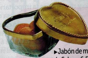
▶ Jabón de manos, de Sabon. 6,50 €