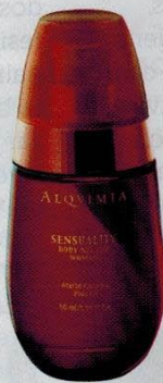
▶ Aceite corporal, de Alquimia. 217 €

● Al salir de la ducha no olvides la hidratación. Lo ideal es que utilices aceites aterciopelados o cremas brillantes.