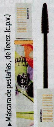
▶ Máscara de pestañas, de Teeez. (c.p.v.)

● Las pestañas infinitas son la clave para seducir con tan solo una mirada. Puedes apostar por las pestañas postizas o por aplicar dos capas de máscara de pestañas.