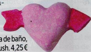
▶ Bomba de baño, de Lush. 4,25 €